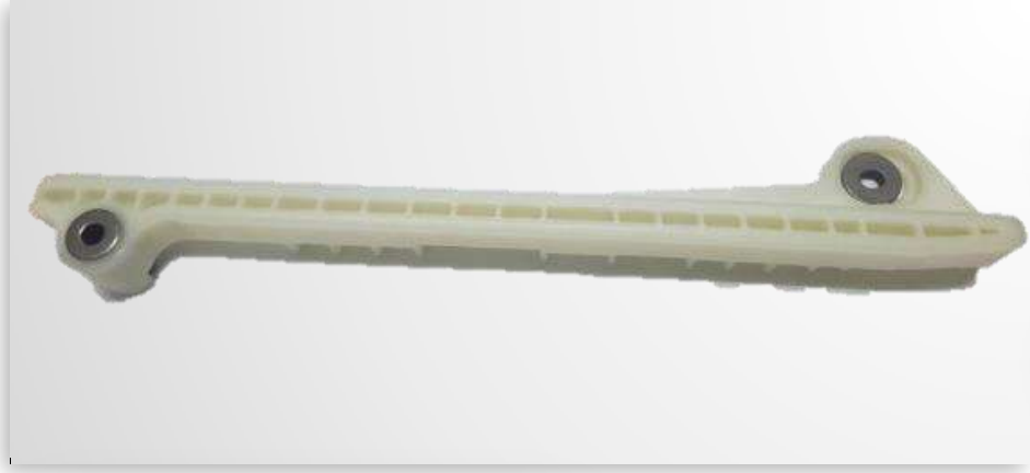
埋螺絲車用引擎產品